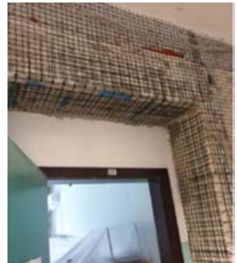
Rinforzi strutturali con sistema CRM